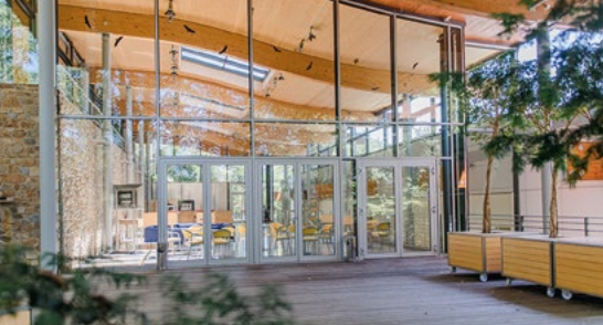
Gedankengebäude der Burg Wernberg Adresse: Schloßberg 10, 92533 Wernberg-Köblitz