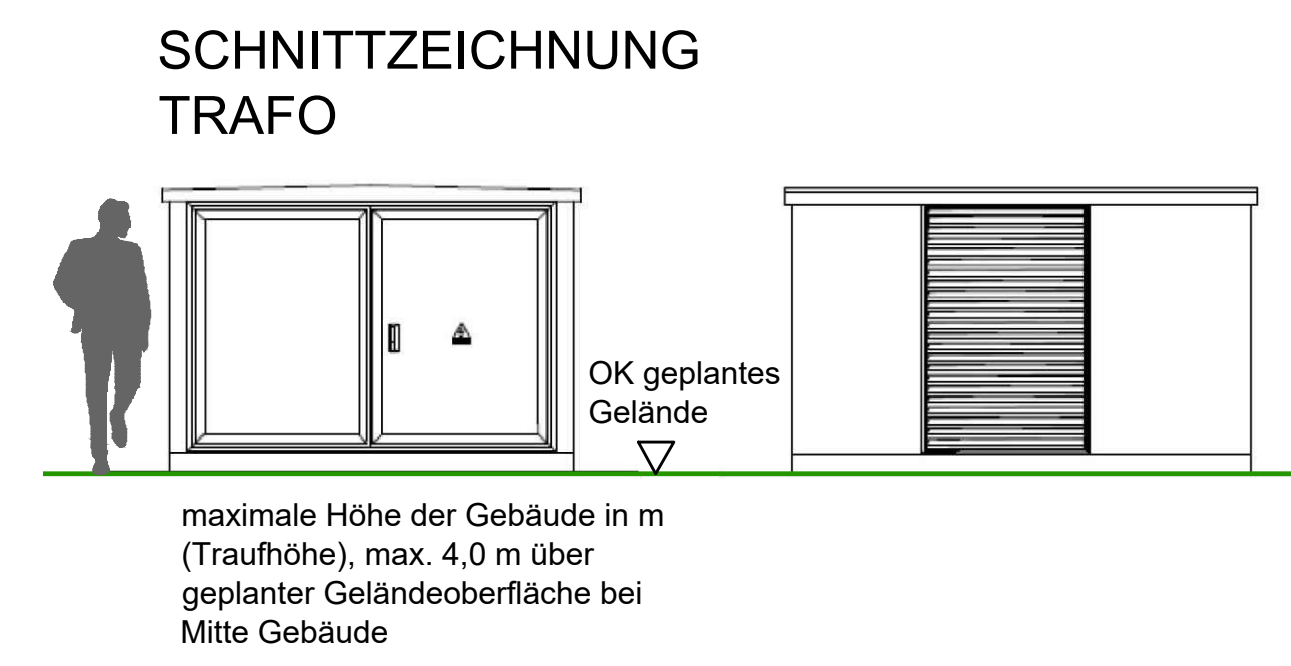
Detail Trafo M 1:50