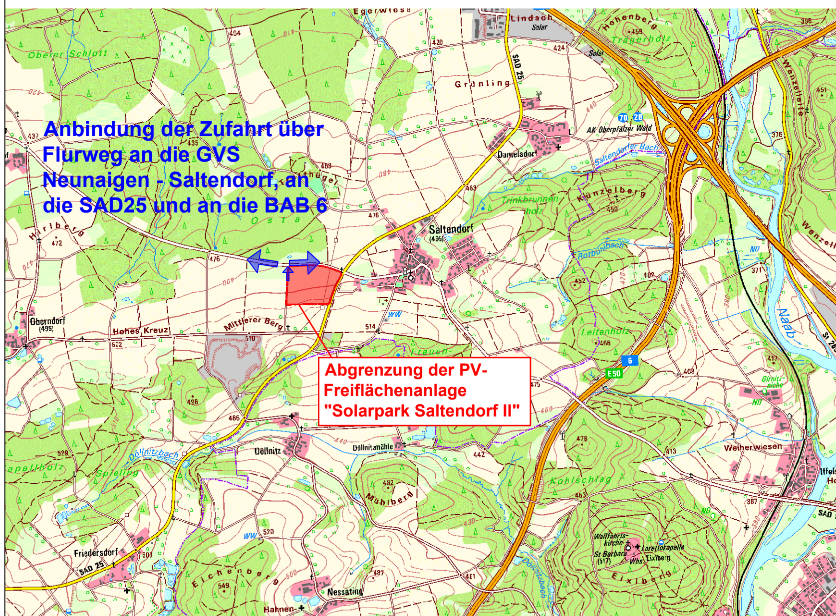
Übersichtslageplan M 1 : 25.000