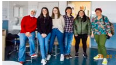
Frau Kusche in Begleitung einzelner Studierenden von der Fachschule für Grundschulkindbetreuung

Die OGTS Wernberg steht auch künftig Auszubildenden als Praxisstelle zur Verfügung. Die anschließende Reflexion fand bei Kaffee und Kuchen im Kinderrestaurant statt und war für die Schü-