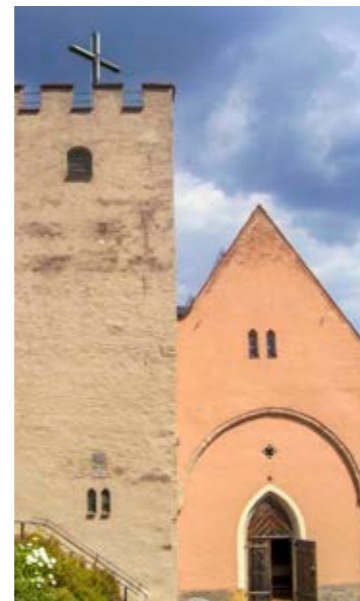
Versöhnungskapelle und Sachsenturm als Überbleibsel der einstigen Pfarrkirche: Für sie waren die Glocken bestimmt.

St. Wenzeslaus war ursprünglich Pfarrkirche von Trausnitz. 1730 wurde sie verlängert und restauriert. Doch 1892 brach man das Langhaus ab und ließ nur mehr den Chor und Sachsenturm als Erinnerungsorte stehen. Die Glocken von 1880 wurden dann in die neue Pfarrkirche St. Josef übernommen.