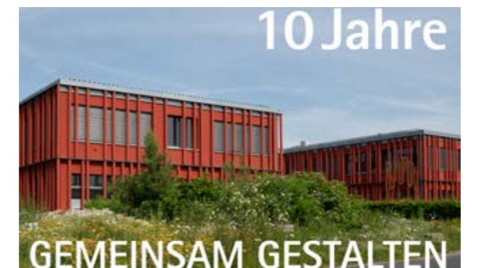
Das Amt für Ländliche Entwicklung Oberpfalz lädt am 18. Juni 2023 zum „Tag der offenen Tür“ nach Tirschenreuth ein.

Freuen dürfen sich die kleinen und großen Gäste auf Attraktionen wie beispielsweise den Close-Up-Zauberer Marco Knott, ein Polizei-Puppentheater sowie