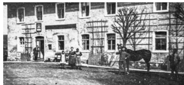
Im Gasthof Sperl – damals „Restauration zur Eisenbahn“ – stärkte sich die Delegation aus Trausnitz.