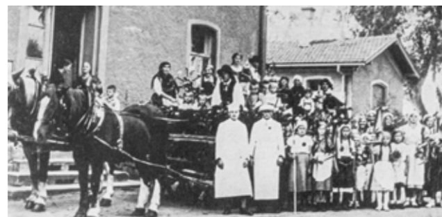
Pferdegespann am Bahnhof Wernberg 1938: So könnte man sich die Ankunft der Glocken 1880 vorstellen.