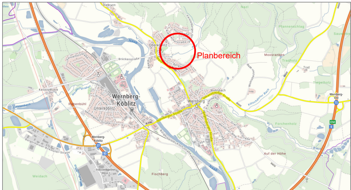
Auszug aus BayernAtlas, Bayerische Vermessungsverwaltung

Das hier betroffene Areal liegt im nord-östlichen Teil des Hauptortes im Ortsteil Oberköblitz, an der Feistelberger Straße.